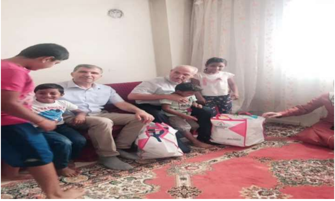
Ramazan ayı münasebeti ile Şehit Ailelerimiz ve Gazilerimiz ile iftarda bir araya geldik.