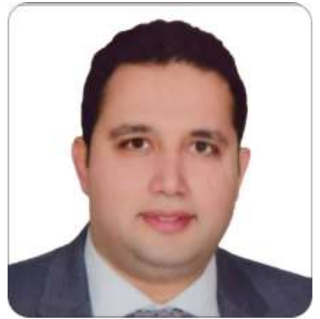
İBRAHİM HALİL TOPAL MECLİS 2.BAŞKAN VEKİLİ