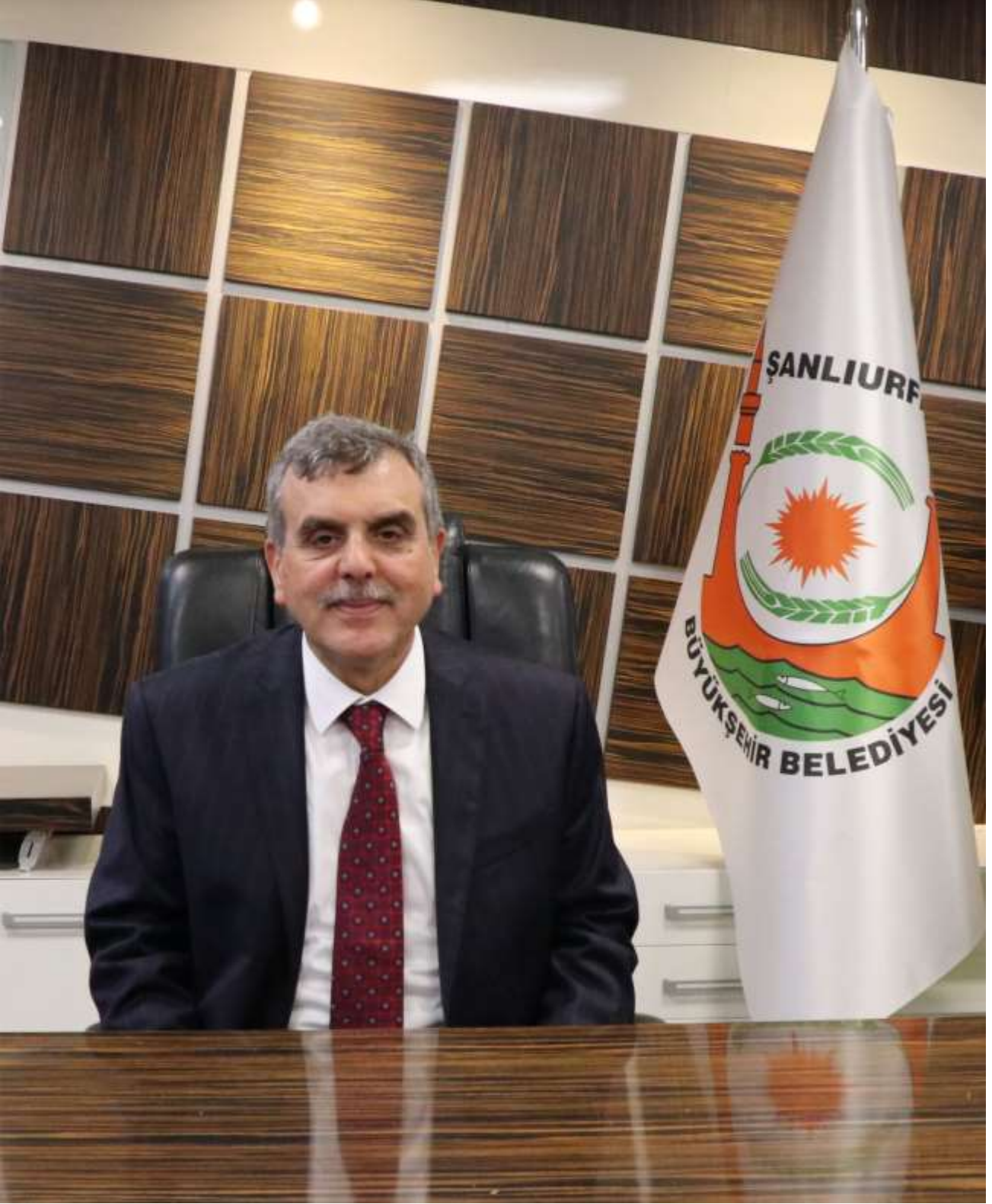
Zeynel Abidin BEYAZGÜL Büyükşehir Belediye Başkanı