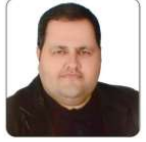
Oktay DOĞAN (MHP)