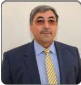
Şih Müslüm KORKMAZ (Meclis Üyesi)